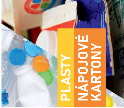
PLASTY NÁPOJOVÉ KARTONY