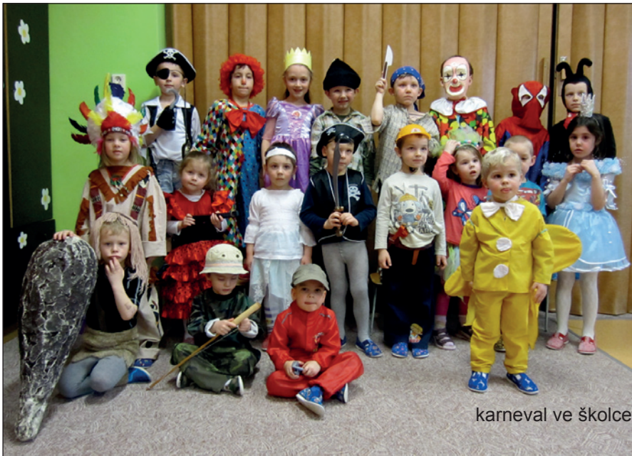
karneval ve školce