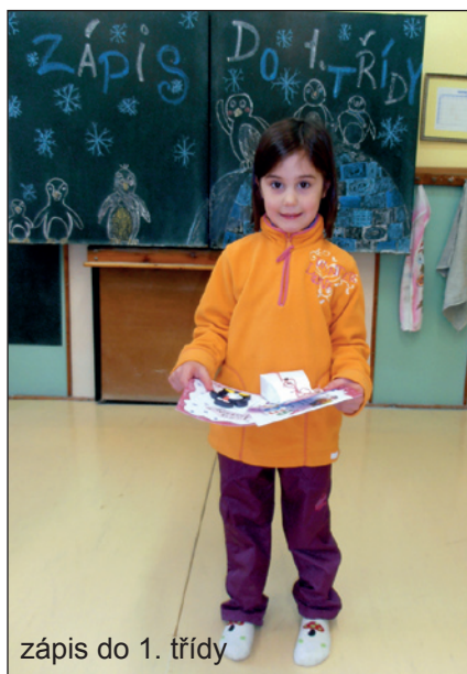
zápis do 1. třídy