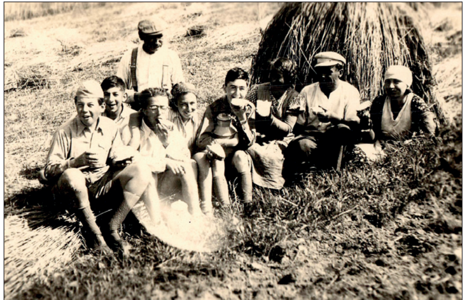
Skupina židovských dětí ve Verměřovicích, léto 1939