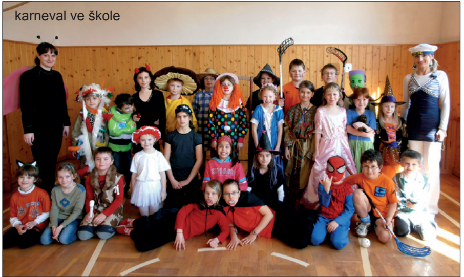
karneval ve škole