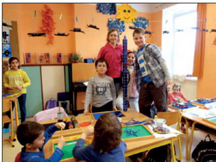
práce se stavebnicí geomag