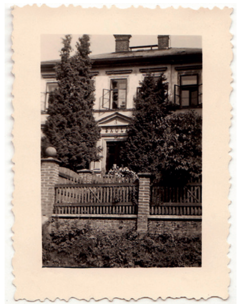
Verměřovická škola v roce 1939