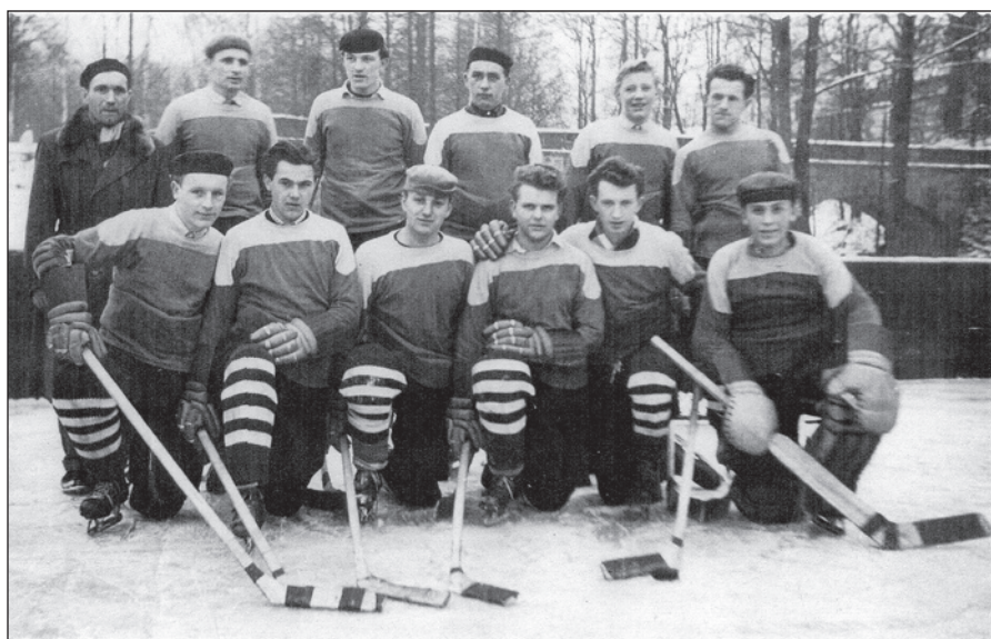
PRVNÍ HOKEJOVÉ MUŽSTVO TJ SOKOL VERMĚŘOVICE 1954 - 1955