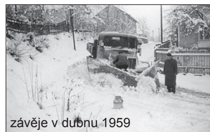
závěje v dubnu 1959

Rok 1904 vyznačoval se neobyčejným suchem. Od první polovice května do druhé polovice srpna nebylo vůbec žádného deště, takže i nejhlubší studně byly zde úplně zbaveny vody. Přes řeku bylo možno přejít po malých kamenech úplně suchou nohou.