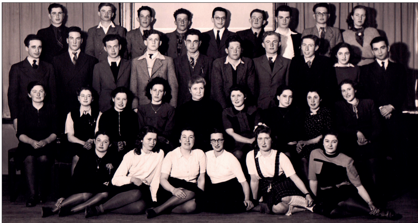
Mladí lidé, kteří trávili léto 1939 ve Verměřovicích, žili od podzimu 1939 v Dánsku. Poznáváte někoho na snímku? Foto je z roku 1942.