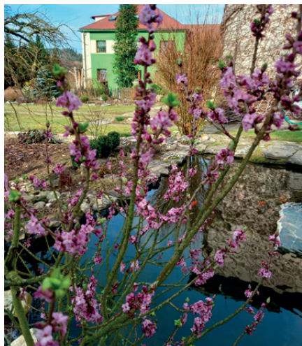
18. února 2024 - rozkvetlý lýkovec

Po nadprůměrně teplé poslední dekádě prosince se počasí nezměnilo ani v lednu. Do 6. ledna se pohybovaly noční teploty okolo +3°C, denní vystoupily do +8°C. Střídaly se slunečné dny s pochmurnými deštivými, 4. ledna dokonce přešly přes republiku první bouřky. Potom se prudce ochladilo, 7. ledna byl první den s celodenním mrazem -5°C. 8. ledna už byl celodenní mráz téměř -8°C, přes noc klesala teplota až k -14°C. Ledové dny trvaly až do neděle 14. ledna, celkem 7 dní, dva dny se pohybovaly teploty na hranici nuly a až do 21. ledna pokračovaly lehce pod nulou. V noci se pohybovaly mezi -5 až -10°C. Velmi příjemné bylo sluníčko, které pomáhalo zmírnit nepříjemný vítr, který foukal téměř každý den. Až dokonce měsíce trvalo chladné počasí, napadlo asi 10cm sněhu. Postupně se oteplovalo, sníh rychle mizel. Únor už začal s teplotami v noci i ve dne nad nulou a srážky byly pouze dešťové. Rekordní teplota byla u nás naměřena 10. února +12,5°C, v noci neklesla pod +8°C. Na zahrádkách vykvetly první jarní sněženky a další pozdravy jara. Celý únor byl ve znamení teplých dnů i nocí, jen jednou klesla teplota k -2°C, noční průměr se pohyboval okolo +5°C. Denní teploty ve Verměřovicích stoupaly maximálně k +12°C, v republice byly v některých oblastech výrazně vyšší. Rekordní byly nejen únorové teploty, ale také srážky, sice jen dešťové. V celé republice meteorologové zaznamenaly o 160% vyšší srážky než v jiných letech.