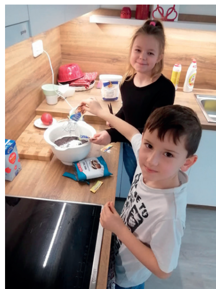
pečeme ve školní družině