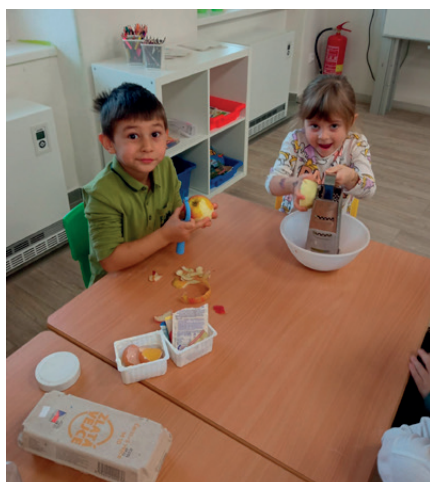
pečení martinských rohlíčků