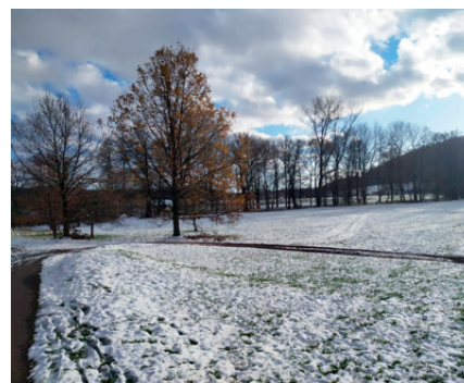
23. listopadu 2024 – první sněhová nadílka

la, že se denní teploty pohybovaly do -1°C. Až do 20. listopadu se střídaly deštivé dny se slunečnými, v noci klesala teplota k nule nebo pod nulu. 20. listopadu nastal zvrát. Po silném větrném dni k večeru napadla několikacentimetrová vrstva sněhu, první sníh však neměl dlouhé trvání, postupně odtál. Jaký bude další průběh letošní zimy se musíme nechat překvapit. Vzhledem k tomu, že Velikonoce v roce 2024 byly po několika letech teplé, budeme doufat, že se vyplní prarostika a budeme mít chladné Vánoce se sněhem a taky konečně tu pravou ladovskou zimu.