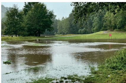
15. září 2024, 11:40 hod.

poledne dokonce svítilo slunko a lidé si tak mohli oddychnout. Velmi vážná situace však nastala v Olomouckém, Severomoravském kraji, v jižních a severních Čechách. Škody na majetku jsou v řádech desítek miliard, bohužel byly i ztráty na lidských životech. V dalších dnech už bylo příjemné slunečné podzimní počasí beze srážek, s teplotami přes den okolo 20°C, v noci do 10°C. Na konci měsíce se však ochladilo, teploty v noci klesaly až nule, střídavě přišlo, foukal silný vítr. Za měsíc září napršelo ve Verměřovicích celkem 224 ml na m 2 .