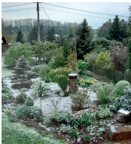
19. dubna 2024 – sněhový poprašek

Měsíc březen začal první dny slunečným počasím, už bez deště. Krásné počasí, slunečné dny, noci bez mrazů, přes den teploty mezi 10 - 13°C pokračovaly celou první dekádu. Potom zapršelo, rekordní teploty byly měřeny po celé republice. 15. března byla zaznamenána nejvyšší teplota v Doksanech, a to 20,6°C. Nadprůměrné teploty trvaly dál, 15. a 16. byly zaznamenány další bouřky. 18. března se prudce ochladilo, ve Verměřovicích klesla teplota k ránu až na -3°C, přes den bylo pouze +5°C. Třetí březnová dekáda byla chladnější, počasí typicky aprílové. Zato poslední víkend v březnu, na který připadly Velikonoce, se vydařil. Od pátku do pondělí se denní teploty pohybovaly okolo 21°C, foukal však velmi silný vítr. V pondělí odpoledne se zatáhlo, přehnal se prudký déšť, který přinesl mírné ochlazení. Příjemné slunečné počasí s občasnými srážkami pokračovalo i v dalších dnech, ve dnech 6. až 9. dubna byly zaznamenány rekordní teploty v celé republice. Ve Verměřovicích se v těchto dnech zastavila teplota na hranici letního dne, to je 25°C, v Rožnově pod Radhoštěm byla naměřena teplota 31,5°C, což už je tropický den. Prudké