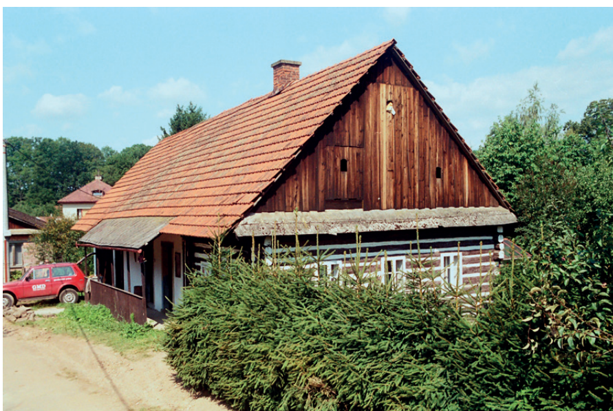
klubovna Skautů 2004