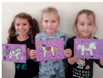
slavíme sv. Martina

Přejme si všichni navzájem, aby dnešní rychlý svět alespoň v předvánočním čase trochu zpomalil, v našich srdcích vzrůstala láska k druhým, v našich myslích se rodila upřímná přání svým blízkým, utichl hluk, ustaly neshody a hřála nás radost z maličkostí.