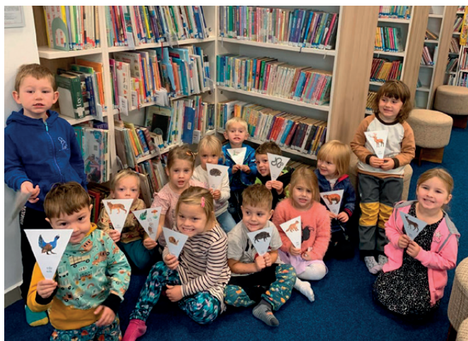
včelíčky v knihovně v Jablonném nad Orlicí