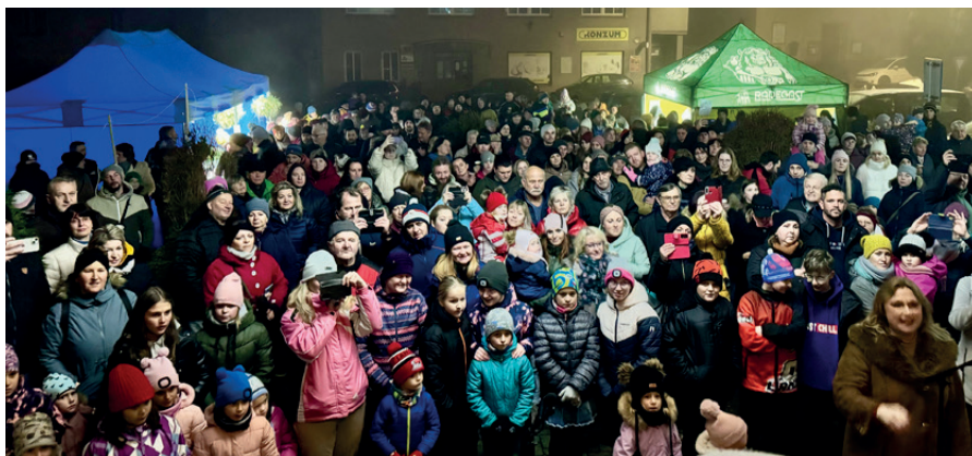
rozsvícení vánočního stromu 30. 11. 2024

Za pár dnů budeme znát vítěze dvou výběrových řízení na stavby, které nás čekají v příštím roce. První by měl být vítěz výběrového řízení na zhotovitele na výstavbu sítí pro 19 RD Na Skalách. Původní plán soutěžit o prázdninách a začít realizaci stavby v září bohužel z mnoha důvodů nedopadl, tak jak bych si přál, ale jsem moc rád, že se nám podařilo najít cestu k našemu cíli. Hned po vyhlášení vítěze této soutěže