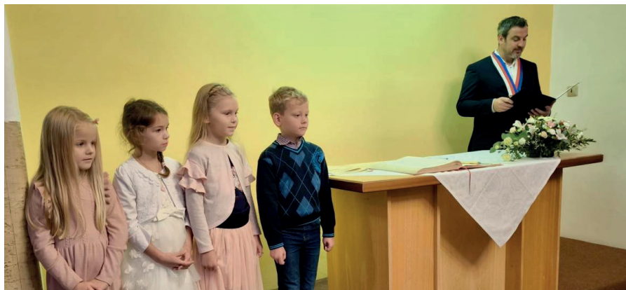
vítání občánků 2.11.2024