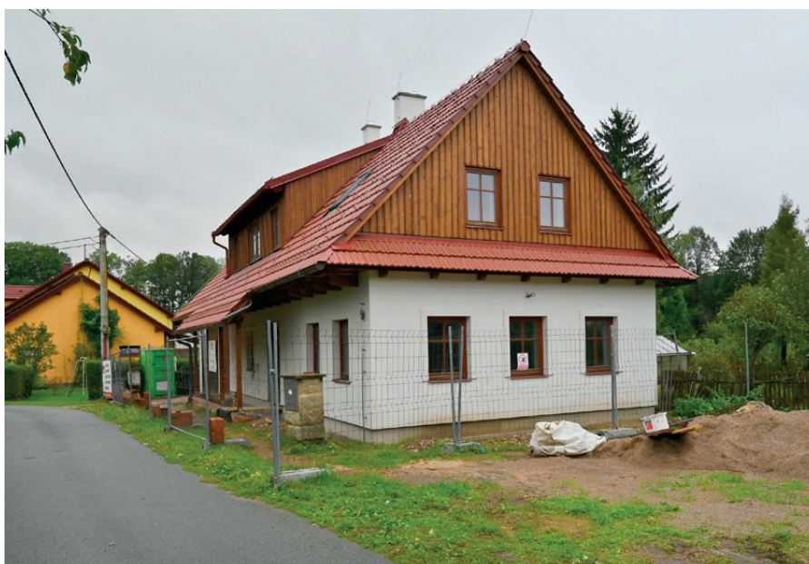
klubovna Skautů 2024