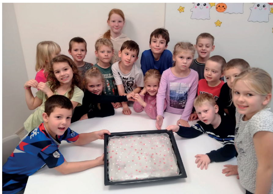
pečeme ve školní družině

přejí zaměstnanci i žáci Základní školy Verměřovice.