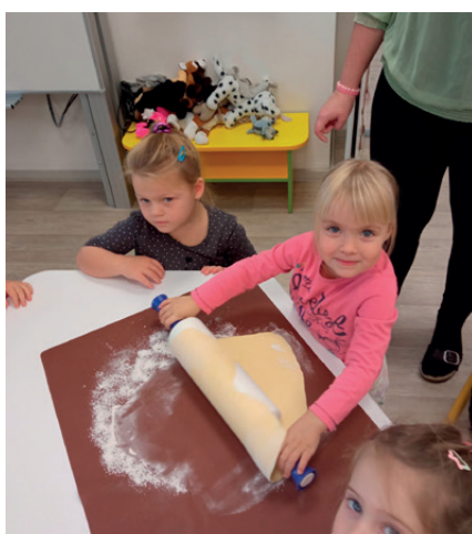
pečení martinských rohlíčků