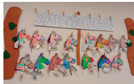
práce dětí v MŠ

Krásný a pohodový adventní čas, prožítý se svými milými a blízkými lidmi. Ať jsou vaše Vánoce plné radosti, smíchu, lásky a pohody.