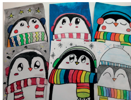
výtvarné práce žáků 4. a 5. třídy