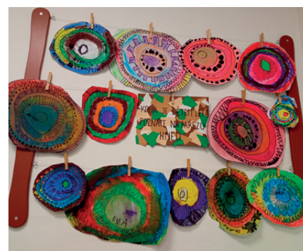
práce dětí v MŠ