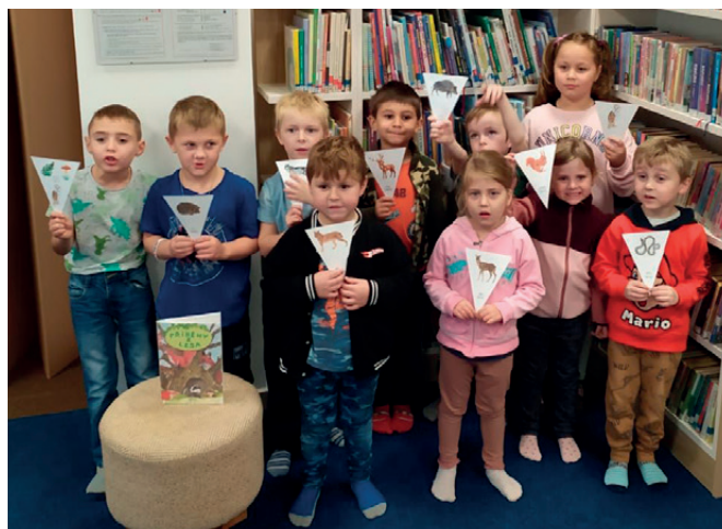
medvídci v knihovně v Jablonném nad Orlicí