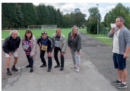
start organizátorů posledního závodu „Z Turecka do Austrálie přes Ameriku“

první medailové místo a zároveň poslední, která v historii tohoto úžasného závodu byla dekorována. Rovněž organizátoři splnili časový limit a dostavili se do cíle v určeném časovém limitu, aby tam oficiálně ukončili konání tohoto neopakovatelného závodu.