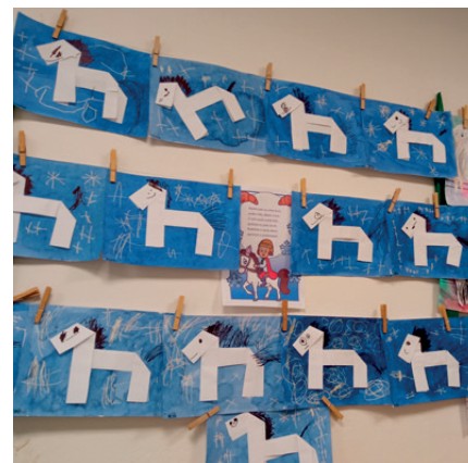
práce dětí v MŠ