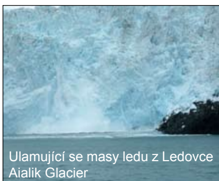
Ulamující se masy ledu z Ledovce Aialik Glacier

Jedním z hlavních našich cílů na Aljašce bylo dostat se k moři, jmenovitě do zálivu přístavního městečka Seward, kde lze pozorovat bohatý mořský a pobřežní život. Vlivem proudění vody i vzduchu záliv nikdy nezamrzá na rozdíl od ostatních pobřežních oblastí. Proto se zde vyvinula neobyčejná flora i fauna. Kromě toho v okolí do vzdálenosti 20-50 mil po moři lze navštívit několik mohutných ledovců, které postup-