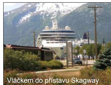
Vláčkem do přístavu Skagway

vydali do neznámé, promrzlé ledové krajiny, za vidinou zlata. Jen zlomek z nich zbohatnul, zato mnozí se již nevrátili.