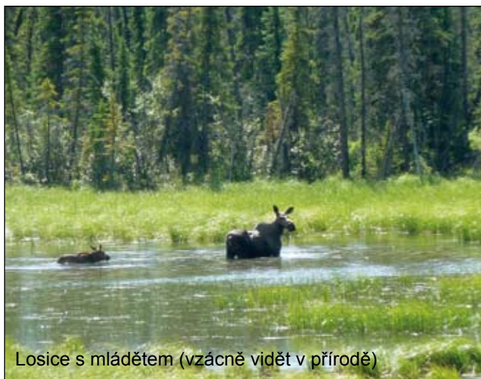
Losice s mládětem (vzácně vidět v přírodě)