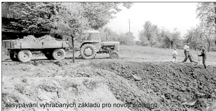
zasypávání vyhrabaných základů pro novou prodejnu

Dne 24. září začali konečně pracovníci okresního stavebního podniku v Ústí nad Orlicí s úpravou terénu pro stavbu dlouho očekávané nové prodejny Jednoty na místě někdejšího čp. 9 proti dosavadní prodejně. Za několik málo dní vyhloubil buldozer prostory pro základy a sklepy, to však byla první a poslední práce na nové prodejně. Za nějaký čas zastavil ONV v Ústí nad Orlicí všechny stavební investiční práce na celém okrese v důsledku celostátních úspor velké rozestavěnosti a realizace naší nové prodejny se oddálila opět na neurčito.