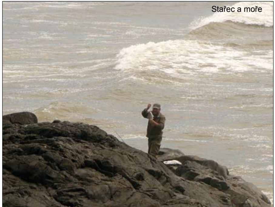
Stařec a moře

Schválně jsem se dosud nezmínil o medvědech, vlčích, kojotech, pumách, jelenech, losech, kariboo, orlech bělohlavých, veverkách zemních, ale hlavně o lososech, sivelech, pstruzích a dalších rybách. Nezmínil jsem se záměrně, neboť tato zvířata nás na dlouhých cestách divočinou, hlubokými lesy, rozlehlými horskými hřbety a údolími doprovázela více či méně neustále a kdybych se tím zabýval podrobněji, tak by se další text už do článku nevešel. Stejně tak rozmanitá je květena, která se zde na severu objevuje krátce, ale intenzivně a svou pestrostí ohromí nejen odborníka. A houby – severní lesy jsou královstvím křemenáčů. Občas jsme