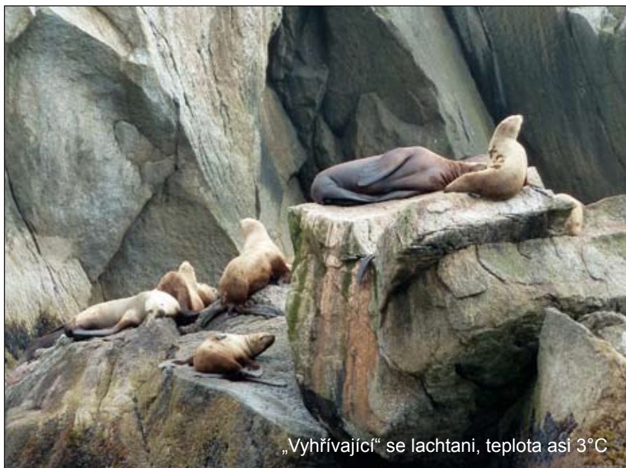
„Vyhřívající“ se lachtani, teplota asi 3°C

Také my jsme se ještě naposledy vydali znovu na skok na Aljašku, tentokrát vláčkem do Skagway a autobusem zpět za Kanadské hranice, abychom vzdali hold tisícům zlatokopů a dobrodruhů, kteří se