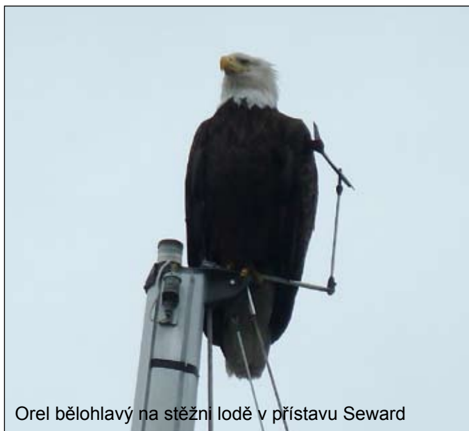
Orel bělohlavý na stěžni lodě v přístavu Seward