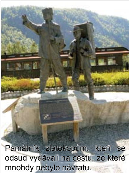
Památník zlatokopům, kteří se odsud vydávali na cestu, ze které mnohdy nebylo návratu.

museli trajektem. Ten plul bez přestávky 18 hodin. Zakotvili jsme v přístavu Port Hardy na ostrově Viktoria. To byl takový předposlední hlavní cíl naší výpravy. Na ostrově již bylo citelně tepleji. I když jsme se pak dostali k oceánu a koupali se v něm, tak to tak nevypadalo. Ostrov jsme projeli od začátku do konce (od severu na jih) asi za týden a opět navštěvovali různá místa, skanseny, města a kempy především na pobřeží Pacifiku, neboť oceán je pro nás vzácný, nutno si jej užít. Protože ostrov Viktoria slouží celé Britské Kolumbii a západní Kanadě jako rekreační oblast, potkávali jsme zde především turisty, domorodce, penzisty, kteří si zde pořídili nějaký ten domek a užívají si pohody a klidu. Je známo, že ze skalisek pobřeží lze pozorovat tahy velryb, poslouchat jejich zpěv a kochat se jejich majestátností. My jsme zrovna takové štěstí neměli, přesto klid a pohoda ostrova v nás zanechala silný dojem.