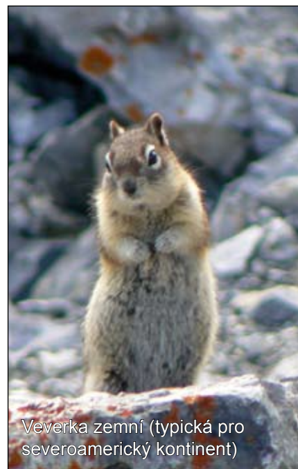
Veverka zemní (typická pro severoamerický kontinent)