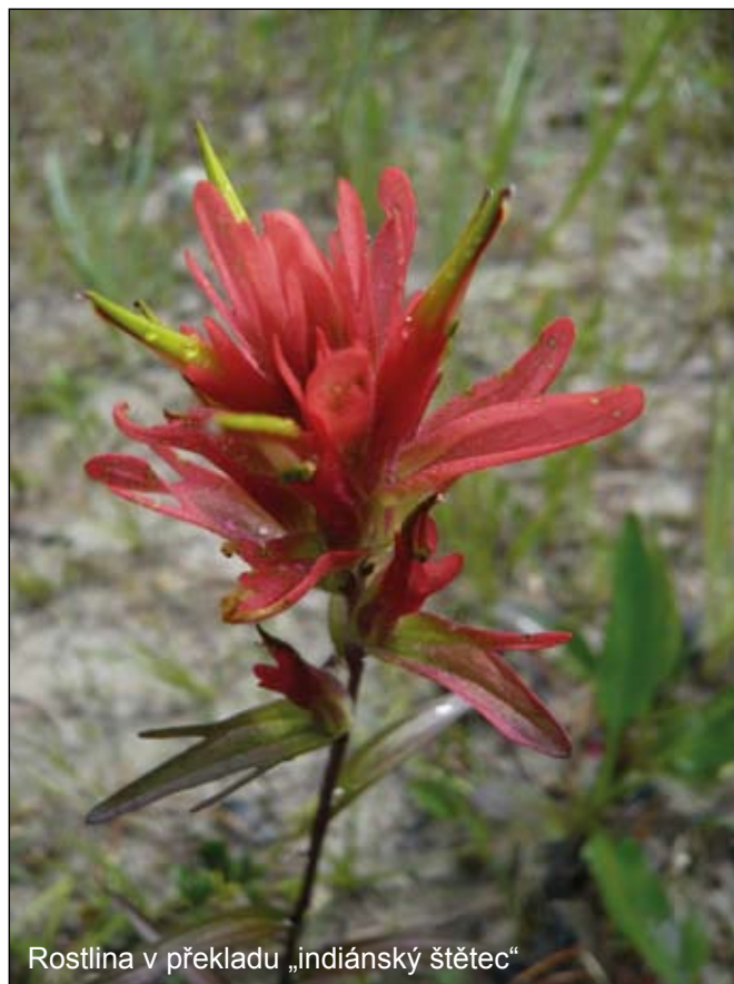
Rostlina v překladi „indiánský štětec“