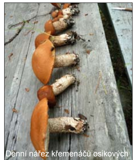
Denní nářez křemenáčů osikových