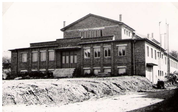
Průčelí KD v září 1965