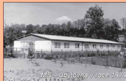
MŠ - ubytovna v roce 1979