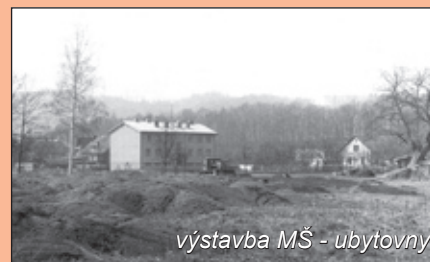
výstavba MŠ - ubytovny