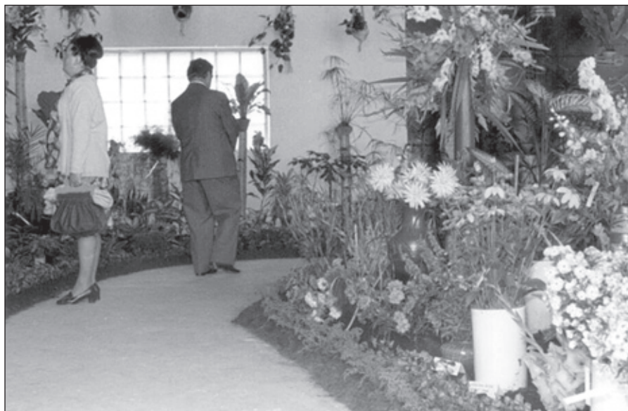
Výstava MO ČOZS Květiny našich domovů, ve dnech 4.-5.8.1979