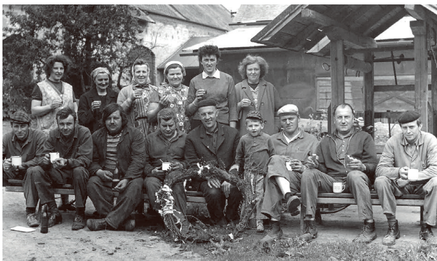
zaměstnanci z dílny a horního kravína

V roce 1949 bylo v obci založeno strojní družstvo. Byly zakoupeny