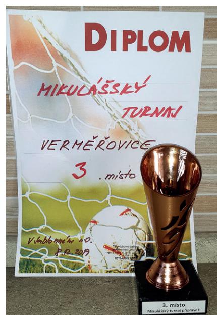
mladší příprava - Mikulášský turnaj v Jablonném nad Orlicí

lym hráčům nemůžeme dát. Fotbal je jedním ze sportů, kde jde hodně o individuální přístup k hráčům a jeden trenér nemůže dát takovou péči desítce dětí. Uvidíme, jaký bude další vývoj našich fotbalistů. Zatím mohu s jistotou konstatovat, že děti do toho dávají vše a výsledky se jistě dostaví.