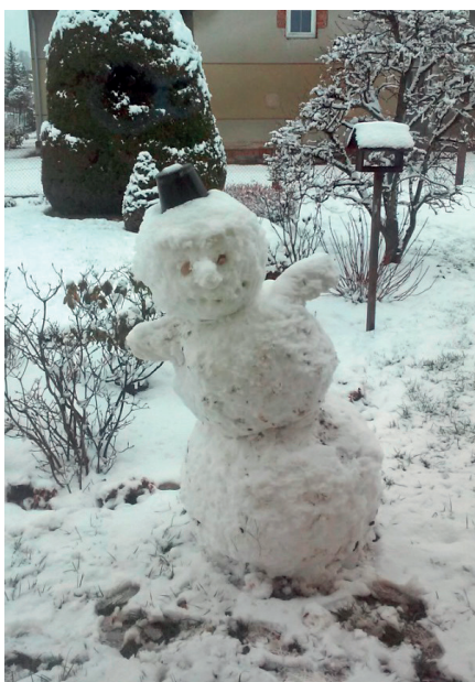
Matouš Pecháček – tančící sněhulák

Všem zúčastněným moc děkujeme za postavení stavby a zaslání fotografie a příští zimu určitě vyhraje vy.