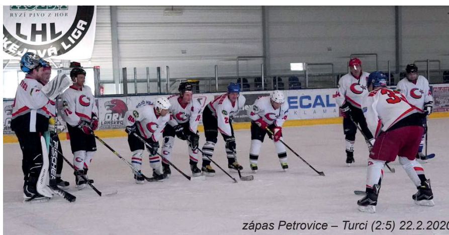
zápas Petrovice – Turci (2:5) 22.2.2020

vlády zrušena i tato soutěž v době, kdy ještě zbývalo každému týmu odehrát zhruba 5 zápasů.