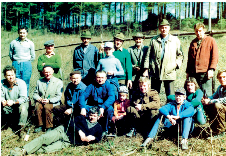
Stromková brigáda v obecním lese 1979

V roce 1991 požádali členi z Kunčic, kteří byli násilně přičleněni do MS Dolní Dobrouč o přijetí do MS Mistrovice, kde jim bylo opět vyhověno. Po 43 letech vznikla honitba s 32 členy a výměrou 2462 ha, totožná s honitbou, která vznikla v roce 1948