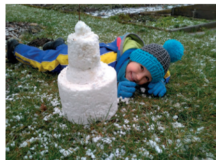
Matouš Pecháček - hrad z čerstvě napadaných krup