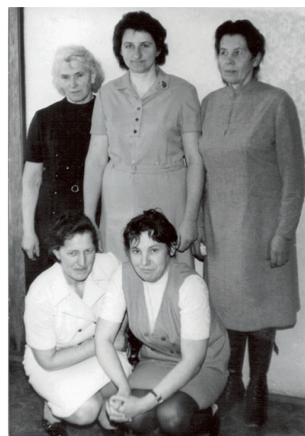
ošetřovatelky skotu z dolního kravína

ného hospodaření našeho družstva v kooperaci s Mistrovicemi a Orlicí pod hlavičkou JZD Podorlicko se sídlem v Mistrovicích. V roce 1975 se připojila obec Bystřec, která k 1. 1. 1990 zase vystoupila.