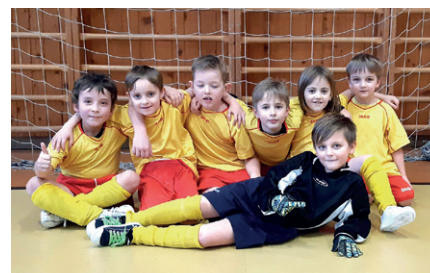
mladší příprava – turnaj v Letohradě

lym hráčům nemůžeme dát. Fotbal je jedním ze sportů, kde jde hodně o individuální přístup k hráčům a jeden trenér nemůže dát takovou péči desítce dětí. Uvidíme, jaký bude další vývoj našich fotbalistů. Zatím mohu s jistotou konstatovat, že děti do toho dávají vše a výsledky se jistě dostaví.