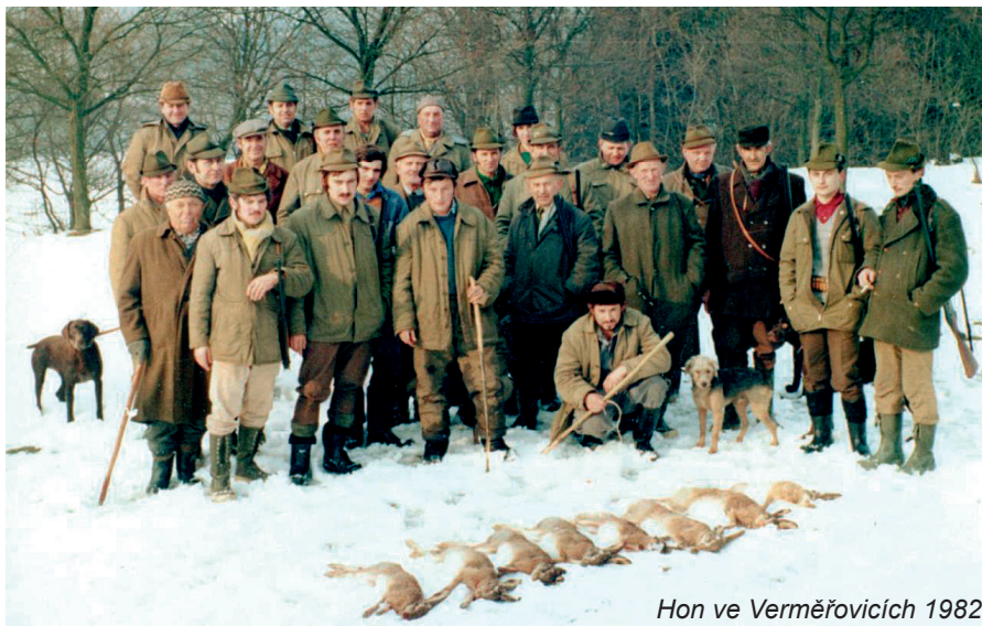
Hon ve Verměřovicích 1982