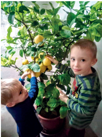
Sklizeň citrónů u Sklenářů.

KDO Z VÁS TO MÁ, KDO Z VÁS TO UMÍ, KDO Z VÁS TAM BYL?