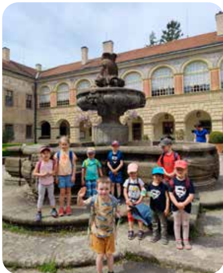
výlet benjamínci Častolovice