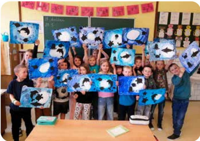
z hodin výtvarné výchovy 1. - 3. ročník