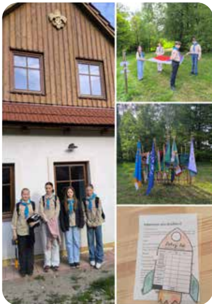
Svojsíkův závod v Pískovně

Druhou sobotu v květnu se v Pískovně konalo okresní kolo Svojsíkova závodu, kterého se zúčastnilo více než 250 skautů a skautek z okresu Ústí nad Orlicí. Byl pro ně nachystán cca 12 km okruh se stanovišti, na kterých plnili různé úkoly. Za náš oddíl se zúčastnila družinka skautek s názvem: Dobří lidi. Věřím, že si holky závod užily a přinesl jim mnoho zkušeností.