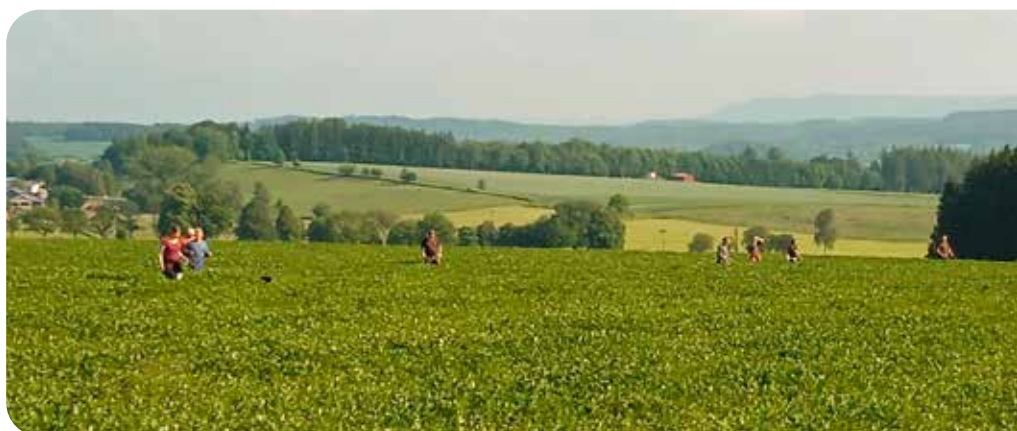
rojnice před sečením jetele

Na podzim nás pak čeká další významná událost – Podzimní zkoušky ohařů a ostatních loveckých plemen psů, na kterých se náš spolek bude organizačně podílet. Tyto zkoušky proběhnou také ve Verměřovicích, a srdečně na ně zveme všechny příznivce kynologie i širokou veřejnost.