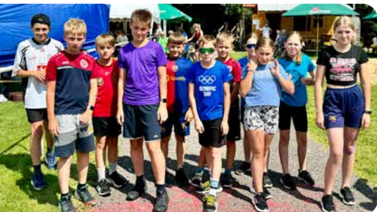
děti do 15 let na startu