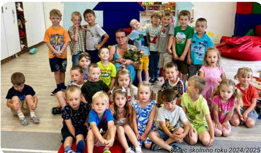
konec školního roku 2024/2025