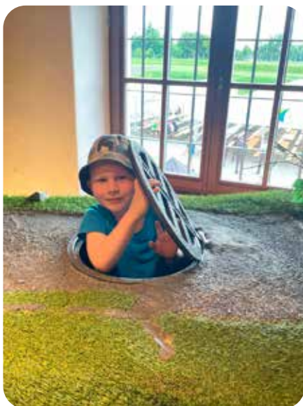
výlet do Olomouce - Pevnost poznání