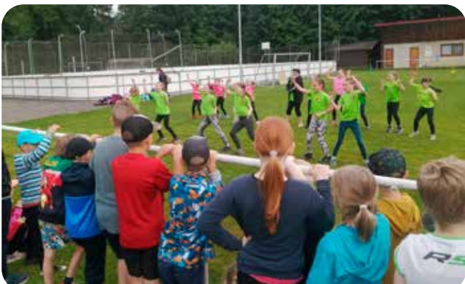
Sportovní den se ZŠ Mistrovice