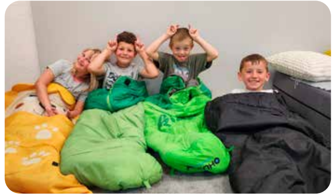
spaní ve škole