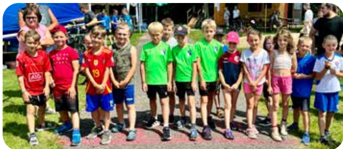
děti do 10 let na startu