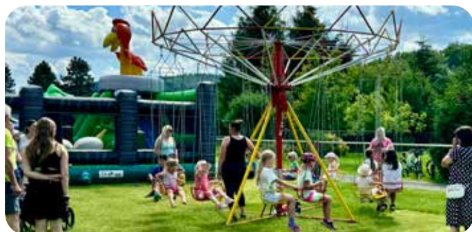
zábavný program pro děti