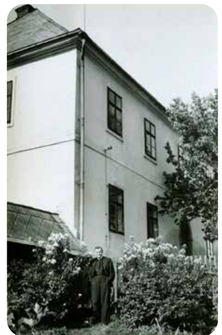
ve farské zahradě

Dožil se požeňnaného věku 83 let. Celých 57 roků svého života věnoval kněžské službě. Z toho 55 let věnoval