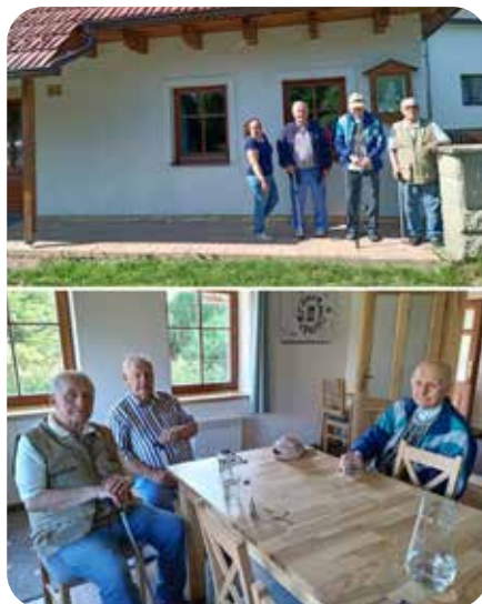
návštěva bratří Čadů

Předposlední červnový víkend byl taky nabitý skautskými akcemi. V pátek v podvečer se v Pískovně uskutečnil slibový oheň, který jsme pořádali společně s Dolní Čermnou. Celý večer byl moc pěkný a přijali jsme do našich řad 10 světlušek a vlčat a dalších 6 skautek