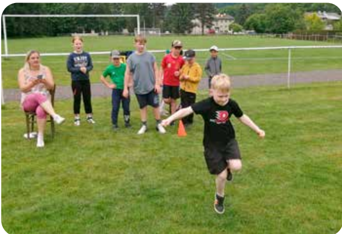
Sportovní den se ZŠ Mistrovice