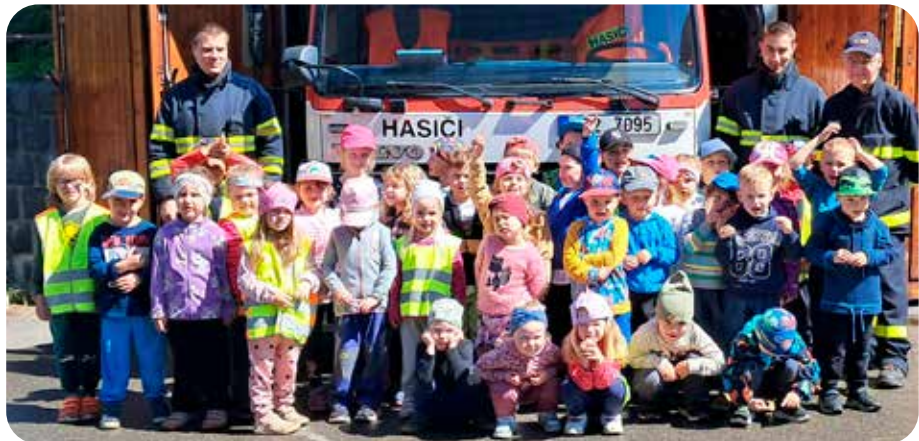
návštěva u hasičů