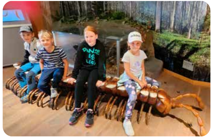
výlet do Olomouce - Pevnost poznání