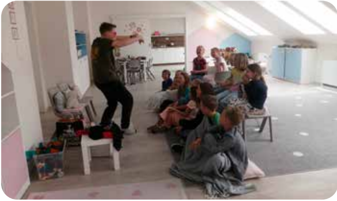
malé improvizované divadlo