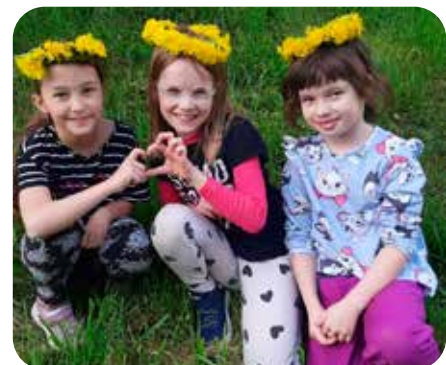
turistická výprava do Cakle

A milí žáci – v září už na vás budeme zase netrpělivě čekat, s novými nápady, dobrou náladou a připraveni prožít další společný školní rok!