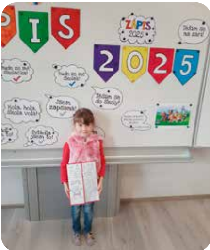
zápis do 1. třídy