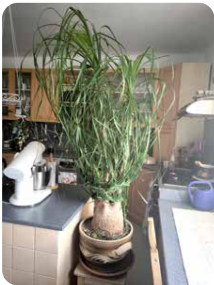
Tuto obrovskou sloní nohu vypěstovali ze semínek u Výprachtických, úžasné.

Kdo z vás to má, Kdo z vás to umí, Kdo z vás tam byl?