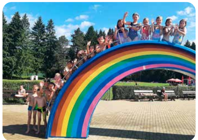
výlet do aquaparku v Ústí nad Orlicí