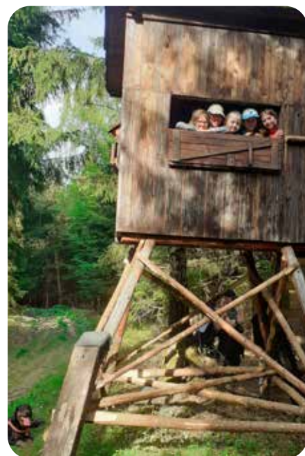
děti z mysliveckého kroužku na kazatelně