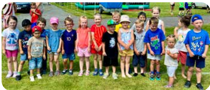
děti do 6 let na startu