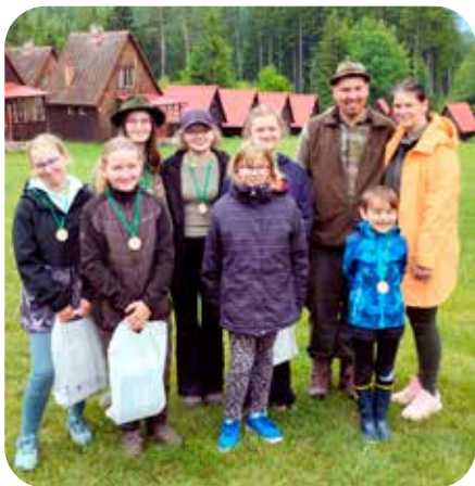
děti z mysliveckého kroužku

Vážení přátelé přírody a myslivosti, náš Myslivecký spolek Na Tiché Orlici, který dnes čítá 29 aktivních členů a hospodaří na rozloze 2 462 hektarů, vstoupil letos v dubnu do nového mysliveckého roku. Ačkoliv oficiální začátek přichází právě s tímto jarním měsícem, přípravy u nás začínají mnohem dříve – už v únoru. V tomto období provádíme tradiční sčítání zvěře, které slouží jako základ pro plánování dalšího hospodaření i lovu. Na základě těchto údajů pak společně nastavujeme rovnováhu mezi péčí o zvěř a udržitelným obhospodařováním naší honitby.