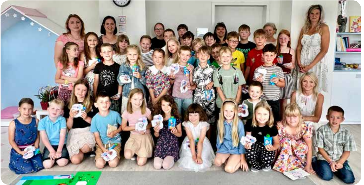
poslední den školního roku 2024/2025