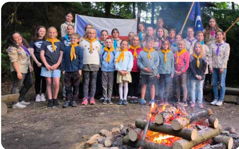
slibový oheň Pískovna

Duben se nesl ve znamení družinových schůzek venku i v klubovně. Družina skautek se chystala na Svojsíkův závod. Vedoucí se v dubnu sešli na radu a plánovali letní tábor. Vlčata měli na začátku dubna víkendovku v klubovně. V sobotu vyrazili na výlet do Králík do vojenského muzea a na rozhlednu na Hedeči. Pak přespali v klubovně a v neděli dopoledne si vyzkoušeli střelbu ze vzduchovky a zbytek dopoledne strávili hraním deskovek. Věřím, že kluci byli nadšení. Čtyry rádkyně od nás z oddílu se na jaře zúčastnily rádcovského kurzu, který jim snad přinesl další nápady. Benjamínci vyrazili do Častolovic, o výletě nám napsala Kiki: Začátkem května jsme se vypravili s naší družinkou benja-