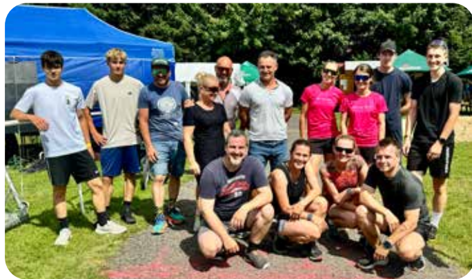
soutěžící nad 15 let