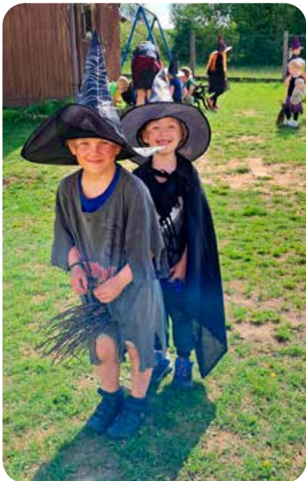
i kluci umí létat