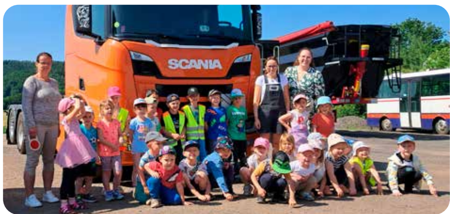
u Čuřilů na kamionech