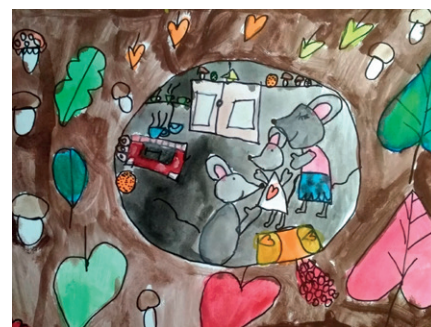
u myší rodinky