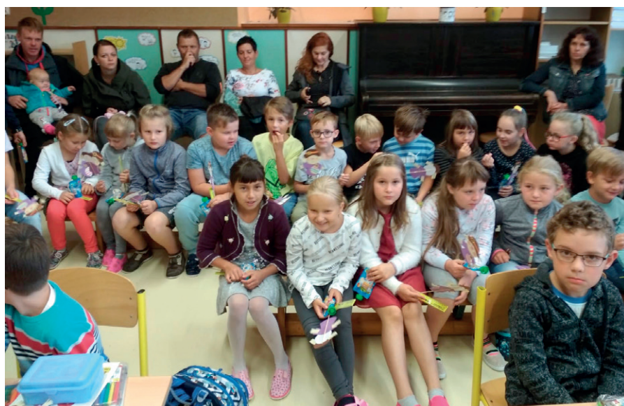
1. školní den