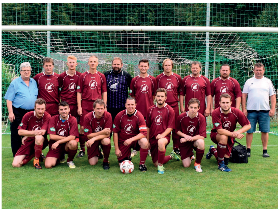
fotbalové mužstvo Verměřovic