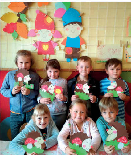
podzimní vyrábění ve družině