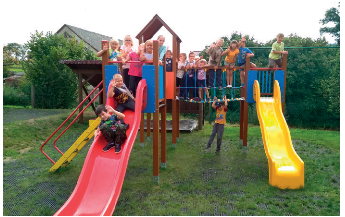
na naší krásné školní zahradě