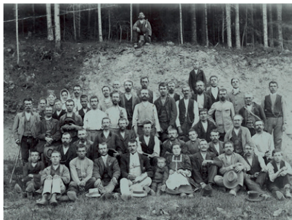
Dělníci na stavbě silnice do Orliček

V září roku 1910, tedy před 111 lety (pozn. red.), začalo se se stavbou silnice K Orličkám p. Josefem Černohousem, podnikatelem staveb v Německé Rybné. Dne 16. listopadu 1911 vyplacena tomuto podnikateli částka K 1 350 za provedení práce při stavbě silnice přes luka k Orličkám a obnos K 1 435 a 56 halířů za provedení více práce na této silnici.