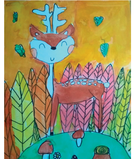
z hodiny výtvarné výchovy