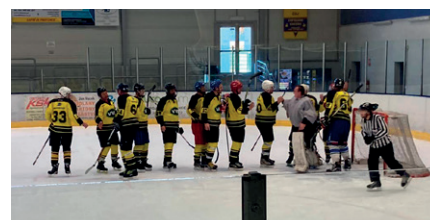
utkání Verměřovice – Sloni