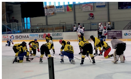
utkání Verměřovice – Sloni