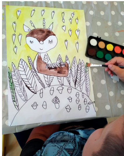
z hodiny výtvarné výchovy