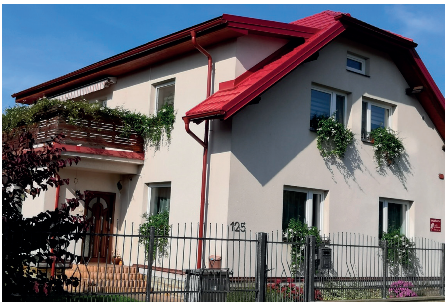
Rozkvetlý dům manželů Kláštereckých.