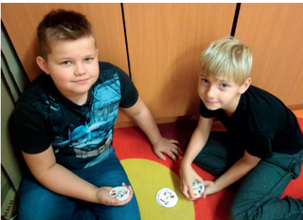
karetní hra do družiny a od Adělčiny maminky, děkujeme