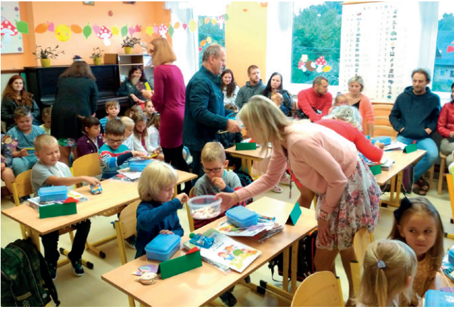
1. školní den