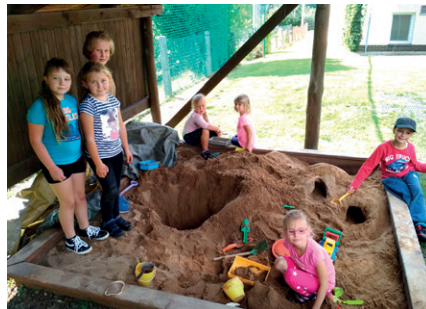
na naší krásné školní zahradě