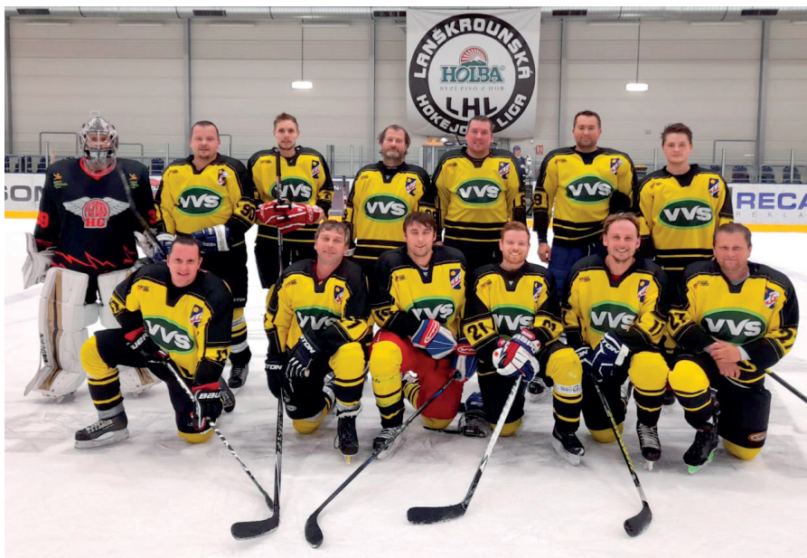
sestava z utkání Verměřovice – AVX