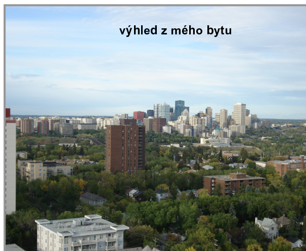
výhled z mého bytu

Současným domovem se mi stal Edmonton, milionové město v západní Kanadě, které je rovněž hlavním městem provincie Alberta. Příznivci hokeje si určitě vybaví team Edmonton Oilers (tj. Olejáři), kde