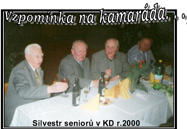
Silvestr seniorů v KD r.2000