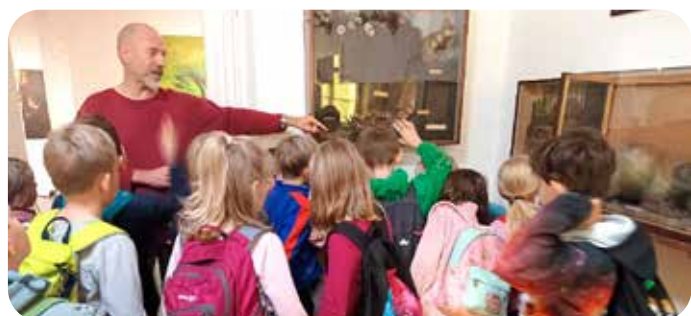
exkurze v Králíkách