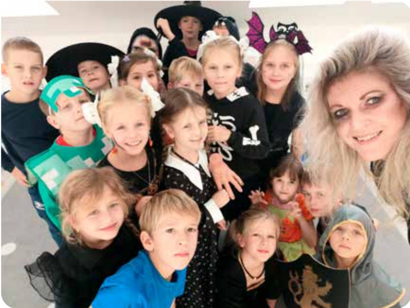
Halloweenská mini párty a pečení sušenek