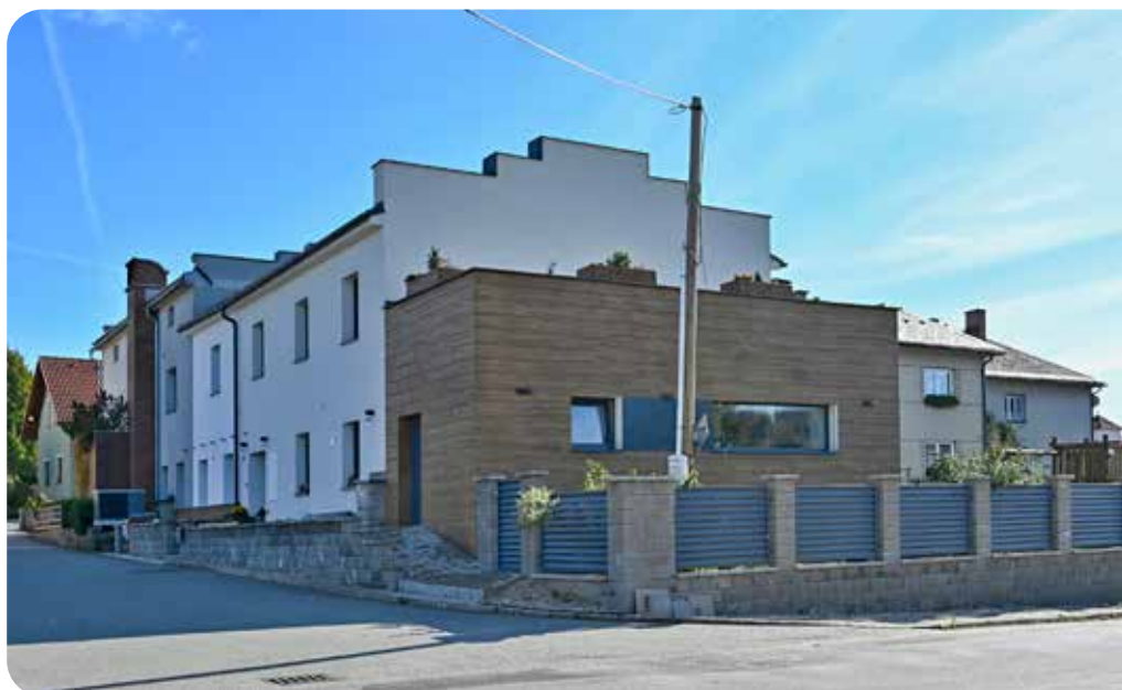
čp. 109, 241 říjen 2025