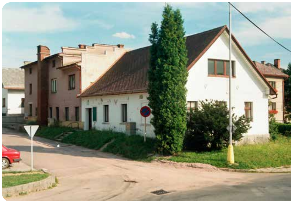
čp. 109, 241 srpen 2002