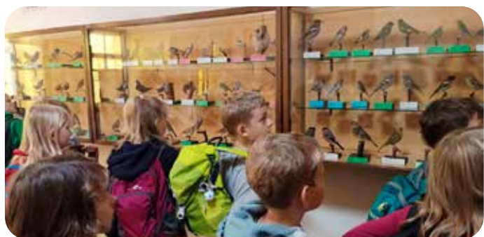
exkurze v Králíkách