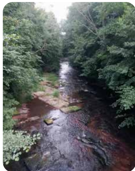
málo vody v řece