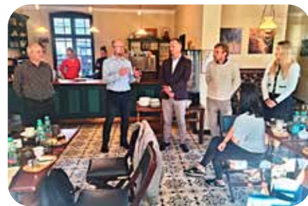
představení postupu české strany

„Inspiroval jsem se už v roce 2014 ve Skotsku, kde jsem viděl nostalgické jízdy nedaleko hory Ben Nevis. Při útlumu využívání některých tratí u nás jsem si říkal, že by to byla výborná příležitost také pro turisty v našem kraji. Od roku 2019 spolupracujeme s Muzeem starých strojů a technologií v Žamberku, které má nyní osm provo-