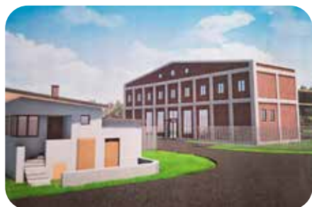
Lipka hradlo a muzeum vizu

Hlavním partnerem projektu spolufinancovaného Evropskou unií prostřednictvím operačního programu Interreg Česko-Polsko je Pardubický kraj. Dalšími třemi partnery jsou polská Nadace pro ochranu slezského průmyslového dědictví, české