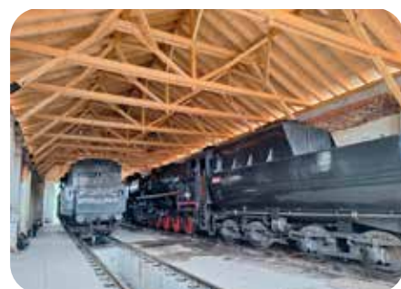
Lipka výtopna uvnitř

Jeho dílny pro muzeum plánují v rámci stejného evropského projektu vyrobit repliku lokomotivy Moravia. Právě Moravia a Austria byla dvojice prvních dvou parních lokomotiv provozovaných na současném území České republiky. Byly vyrobeny ve Velké Británii a obě jezdily od roku 1838