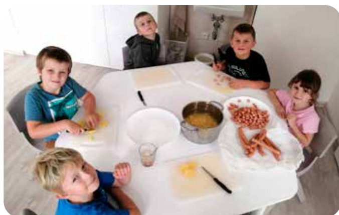
příprava buřtguľáše ve ŠD