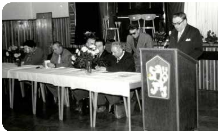
ze slavnostní schůze MNV a NF k 60. výročí VŘSR dne 24.11.1977

O tom, jak vysokou úroveň mělo zpracování jeho kroniky svědčí, že na krajské výstavě kronik v březnu 1957 v Hradci Králové byla tato kronika oceněna čestným uznáním.