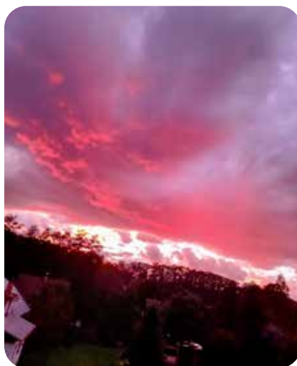
západ slunce v podvečer 5. září 2025

mezi 12 až 15^{\circ}\text{C} , přes den jen občas přesáhly 22^{\circ}\text{C} . Srážky byly téměř na denním pořádku, občas se přehnaly bouřky se silným větrem. Toto proměnlivé počasí s četnými srážkami trvalo až do konce měsíce. Celkem napršelo v červenci ve Verměřovicích 118 mm srážek. Počasí v tomto stylu přešlo i do měsíce srpna. Až 5. srpna přestalo pršet a postupně se vrátily slunečné dny a zvyšovala se denní teplota. 6. a 7. srpna klesaly ranní teploty k +7^{\circ}\text{C} . Na několika místech v republice dokonce mrzlo. Ve druhé dekádě nastala změna. Teploty přes den u nás stouply až k 33^{\circ}\text{C} , noci však zůstávaly chladné, mezi 12 až 15^{\circ}\text{C} . Ve třetí dekádě se postupně ochladilo, v noci teploty klesaly pod 12^{\circ}\text{C} . 24. srpna se dokonce pohybovaly noční teploty ve Verměřovicích okolo +5^{\circ}\text{C} , přes den svítlo slunce, přesto bylo nejvýš 17^{\circ}\text{C} . Nepršelo, občas bylo zataženo a foukal studený vítr. Na konci měsíce následovalo oteplení, teploty do maximálně 28^{\circ}\text{C} přes den, v noci do 17^{\circ}\text{C} , téměř beze srážek. Celkově spadlo v měsíci srpnu 29 mm srážek.