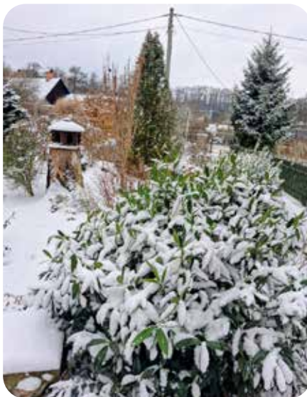
první sníh v roce

Sněhová pokrývka trvala u nás asi do 20. ledna, několikrát nasněžilo, ale výška sněhu nepřesáhla 15 cm. V noci klesaly teploty v rozmezí -3 až -8° C, přes den se pohybovaly mezi -3° C až nulou. Celý leden bylo proměnlivé počasí. Střídavě sněžilo, pršelo, bylo náledí, foukal silný vítr, sluníčko zasvítilo jen občas. 6. ledna se dokonce přes část republiky přehnaly bouřky. Poslední týden měsíce se však mírně oteplilo. Velké rozdíly byly v teplotách v celé republice. Naše oblast byla v pásmu inverzního počasí s minimem slunka a počasím okolo nuly.