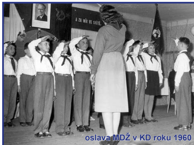
oslava MDŽ v KD roku 1960

Dnem 24. dubna usnesla se vláda ČSR snížit maloobchodní ceny některých druhů potravinářského a průmyslového zboží. Jde především o cukr kostkový z 9,60 Kčs na 9,- Kčs, krystalový z 8,80 Kčs na 8,40 Kčs a práškový z 9,- Kčs na 8,40 Kčs za 1 kg, rybí konzervy, cukrovinky, sirupy, kompoty, kávu výběrová směs z 19,-Kčs na 18,-Kčs za 100g, čaj, oděvní zboží např. pánský oblek jednoradový 70% česané vlny z 900,- Kčs na 800,- Kč, vlněné tkaniny, bavlněné a hedvábné tkaniny, pletené prádlo, punčochy a ponožky, některý bytový textil, kožená galanterie, rozhlasové přijímače např. střední Melodie z 1.550,- Kčs na 1.200,- Kčs, gramofonie, gramofony a gramof. Desky, fotopřístroje např. bFluxaret Va z 930,- Kčs na 810,-Kč, hračky, psací potřeby a sportovní potřeby. Dále byla snížena cena elektřiny pro odběr domácnostmi podle tzv. bytové světelné sazby z 80 hal. na 70 hal. za 1kWh. Vláda ČSR se usnesla poskytovat počínaje školním rokem 1960/1961 všem žákům všeobecně vzdělávacích,