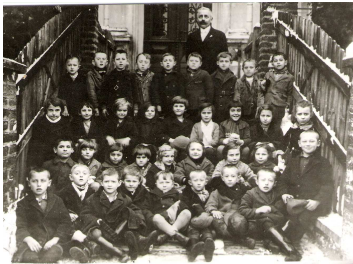
Škola roku 1931 (ročník 1925 – 1927)

U dveří školy jsme měli střídavě službu a prohlíželi jsme boty dětí, tenkrát jsme se