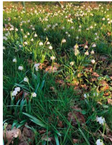
Vackovi – čp. 42 Poříčí