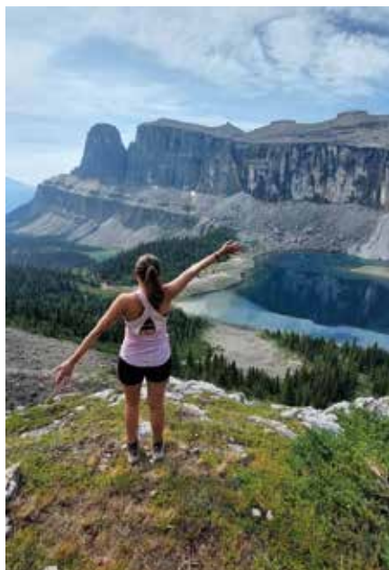
výšlap na Castle mountain připomínající zříceniny hradu

Poslední dny jsem místo v autě přespala u kamarádky a vyřizovala si poslední věci a loučila se se všemi,