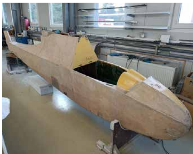
V současné době probíhají práce na trupu letadla.

del, které si nakonec vyžádaly podstatně důkladnější péči, než bylo původně předpokládáno. Při průzkumu torzní skříň levého křídla bylo zjištěno, že se velká část lepených žebber rozpadá. Za tím účelem byly do náběžné hrany provedeny po celé délce křídla otvory, aby bylo možné vyspravit všechna rozlepená žebra a tento prostor impregnovat. Na pravém křídle bylo rovněž nezbytné nahradit téměř celou koncovou část, která byla poničena vlhkostí. Na počátku letošního roku byly zahájeny práce na samotném trupu letadla. Tak jako na křídlech je nyní nejprve nutné demontovat veškeré kovové části a prvky řízení za účelem jejich ošetření a renovace. Je třeba uvést, že celý proces je prováděn za dozoru pracovníků Úřadu pro civilní letectví, kteří naše město za tímto účelem pravidelně navštěvují.