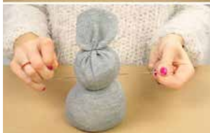
trochu inspirace čerpáno internet