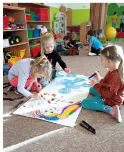
malujeme Paní Zimu