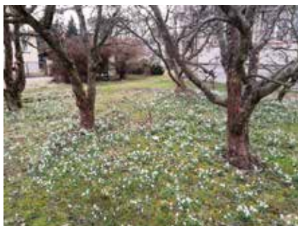
B. Krejsa – čp. 80 Poříčí

Už je tu jaro - sněženky, bledule a ladoňky na verměřovických zahradách.