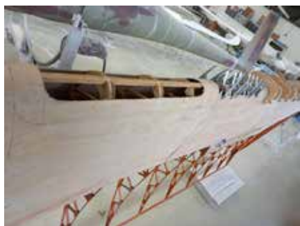
Do náběžné hrany levého křídla bylo nutné provést po celé délce otvory, aby bylo možné vyspravit rozlepená žebra uvnitř torzní skříň

del, které si nakonec vyžádaly podstatně důkladnější péči, než bylo původně předpokládáno. Při průzkumu torzní skříň levého křídla bylo zjištěno, že se velká část lepených žebber rozpadá. Za tím účelem byly do náběžné hrany provedeny po celé délce křídla otvory, aby bylo možné vyspravit všechna rozlepená žebra a tento prostor impregnovat. Na pravém křídle bylo rovněž nezbytné nahradit téměř celou koncovou část, která byla poničena vlhkostí. Na počátku letošního roku byly zahájeny práce na samotném trupu letadla. Tak jako na křídlech je nyní nejprve nutné demontovat veškeré kovové části a prvky řízení za účelem jejich ošetření a renovace. Je třeba uvést, že celý proces je prováděn za dozoru pracovníků Úřadu pro civilní letectví, kteří naše město za tímto účelem pravidelně navštěvují.