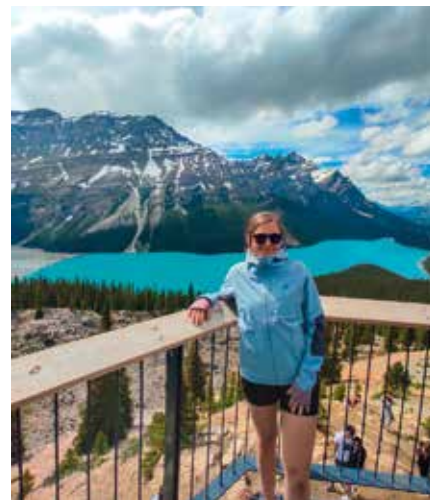
Peyto lake – jezero do tvaru lišky

V létě jsme si půjčili auto a objížďali hory, jezera a vodopády, jelikož v letním období je vše přístupné a nejkrásnější a hlavně bez sněhu. Vystoupala jsem na horu Grotto, která měla 2630 metrů výškových. Otužovala se v ledovcovém jezeru, jezdila na kole nebo campovala v autě, kde si i na cestu na záchod musíte vzít do ruky sprej na medvědy, který je povinný pro veškerý pohyb venku i ve městě. Když jdete na výšlap, je to většinou nad 20 kilometrů s prudkým stoupá-