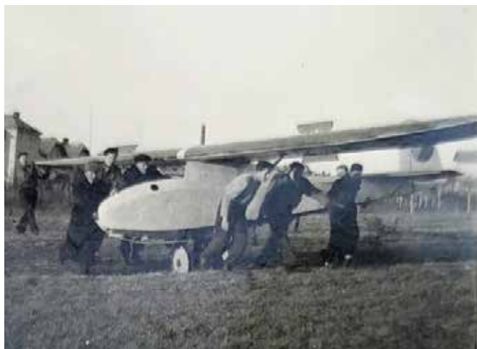
Kluzáky žamberského aeroklubu krátce po válce byly ještě před vybudováním letiště přepravovány každý letový den z provizorního hangáru v Nádražní ulici pod Karlovice, kde na svahu probíhal letecký provoz.