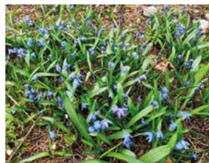
Sklenářovi – čp. 179 vlevo od KD