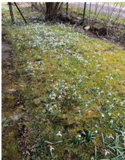
M. Gronych - čp. 8 Obec