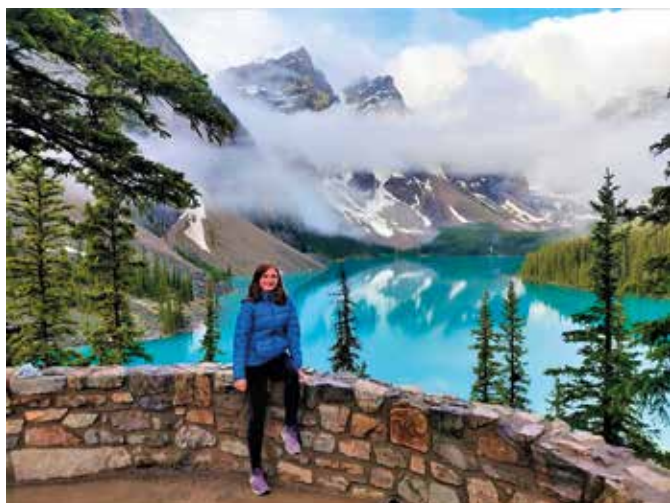
Moraine lake – neznámější jezero v Kanadě

Na podzim jsem si půjčila auto od kamarádky, sbalila si pár svých švestek a vyjela jsem na měsíc z Canmore na Vancouver Island. Jela jsem přes Kelownu - slunné město a ráj vinařů přes lesnaté kanadské parky do Vancouveru, kde jsem trajektem plula na malý ostrov. Na Ostrově je zakázáno spát mimo kempy, ale já jsem si vždy poradila. Přes aplikaci mapy jsem si našla parkoviště většinou u hřišť nebo parků a v tichosti v autě přespala. Občas jsem strach měla, ale byl to veliký adrenalin, který mi přidával vnitřní sílu. Zpátky jsem si prohlédla město Vancouver, kde se pořádaly Olympijské hry. Měla jsem štěstí, že celou dobu bylo slunečné počasí. Mohla