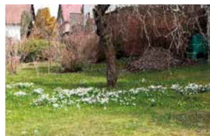
Vackovi – čp. 143 vedle KD