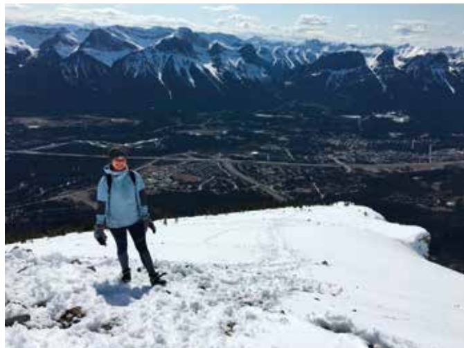
výstup na Grotto Mountain