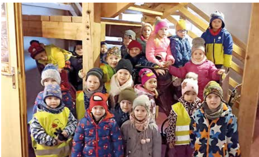
exkurze do Muzea řemesel Letohrad