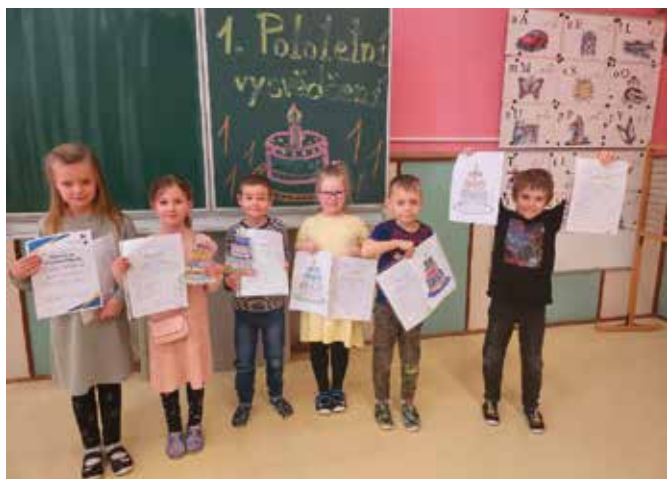
pololetní vysvědčení 1. třída