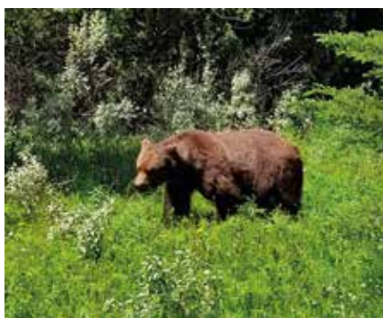
úlovek z auta medvídek Grizzly

kteří jsem poznala. Byla jsem ráda, že jsem odjela v pravý čas, protože týden po příletu domů - na začátku listopadu bylo v Canmore - 27 °C.