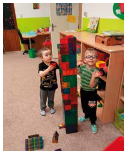
nová stavebnice od Ježíška