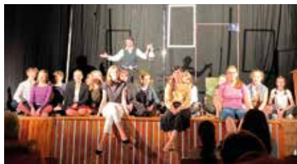
divadelní soubor Škeble

Koncem února byl ve znamení zábavy. V sobotu 25. února proběhl tradiční hasičský ples a neděle patřila divadelnímu souboru z lanškrounského gymnázia Škeble, který k nám do KD přijel zahrát veselohru „Amina ex machina“.