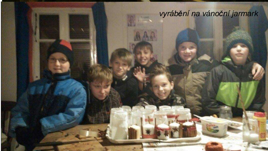
vyrábění na vánoční jarmark

Obě družstva nám udělala velkou radost svým zápalem a chutí do hry. Konkurence byla velká, celkem se zúčastnilo 17 týmů z celého okresu. Uvidíme, jestli příští rok své umístění obhájíme.“