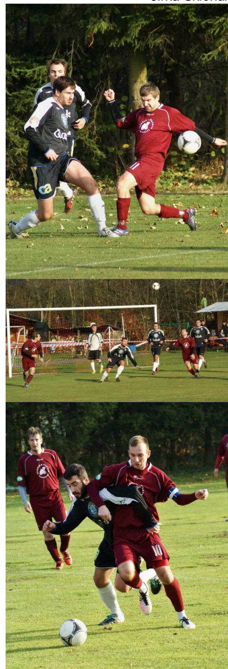
fota ze zápasu Verměřovice – Sloupnice