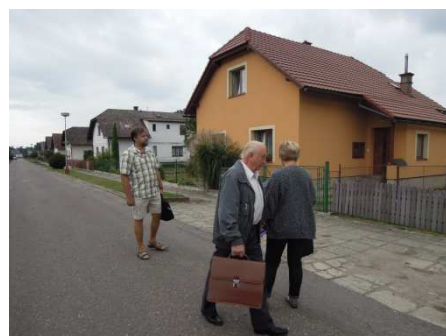
u čp. 31 na Poříčí