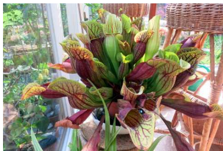
Streptocarpus (tořivka) a Spirlice (Sarracenia) Blanky Sklenářové