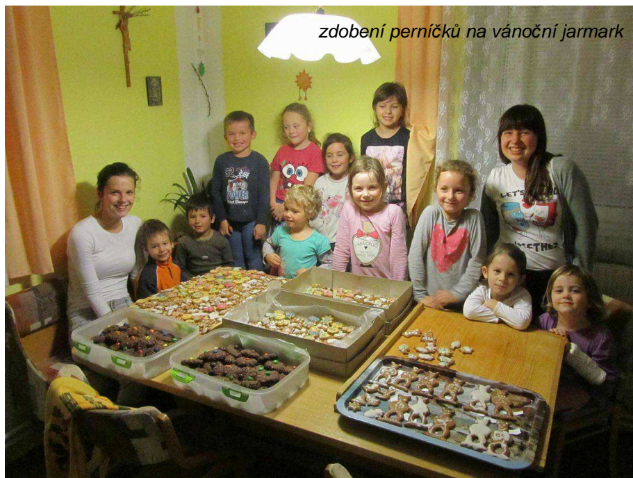
zdobení perníčků na vánoční jarmark