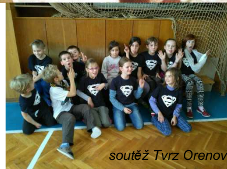
soutěž Tvrz Orenov

Přípravám a vyrábění na jarmark se věnovaly i ostatní děti. Světlušky stříhaly andílky, vlčata lepila přáníčka a skauti zdobili svíčky. A vedoucí? Když zrovna nevyrábí s dětmi, snaží se zapracovat na naší