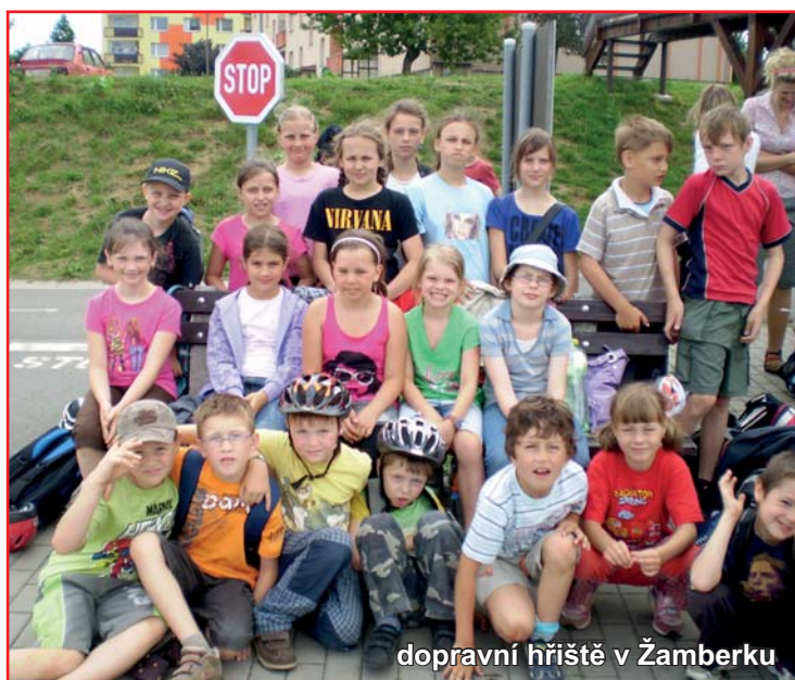
dopravní hřiště v Žamberku