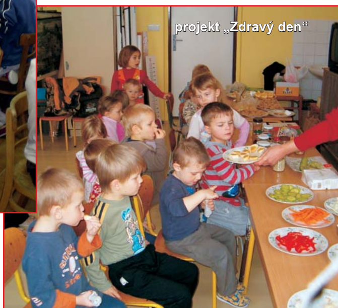
projekt „Zdravý den“