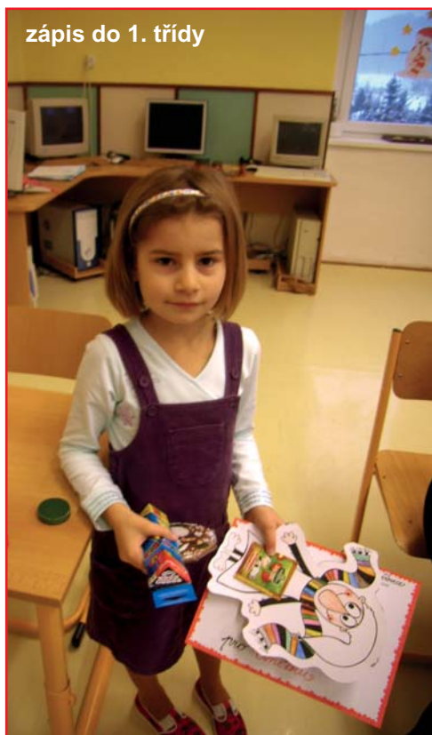
zápis do 1. třídy