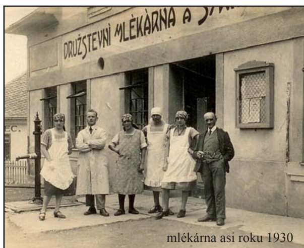
mlékárna asi roku 1930

Do této mlékárny jezdilo mnoho mlynářů z okolních vesnic. Naši hospodáři – zemědělci postavili tuto mlékárnu a založili družstvo, bylo to velké dílo na tehdejší dobu.