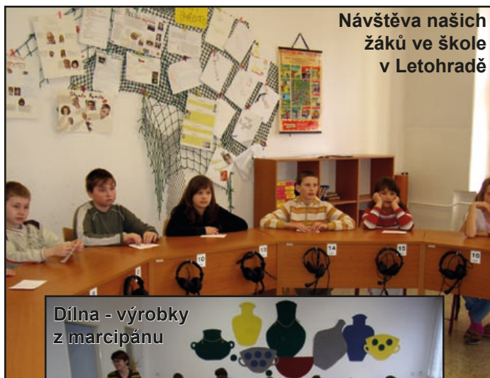
Návštěva našich žáků ve škole v Letohradě