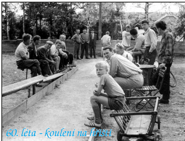
60. léta - koulení na hřišti