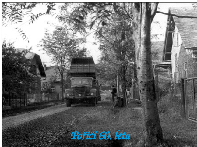
Pořiči 60. léta

Dnem 1. července vstupuje v platnost nová územní organizace našeho státu. Republika má pouze 10 krajů, každý kraj méně, ale větších okresů. Naše obec náleží nyní okresu Ústí nad Orlicí, který vznikl spojením celého bývalého okresu Ústí nad Orlicí, Lanškroun, 2/3 Žamberka, části Vysokého Mýta a připojením několika obcí bývalých okresů Šumperk a Litomyšl. Okres Ústí n. O. náleží pak kraji Východočeskému s krajským městem Hradec Králové.