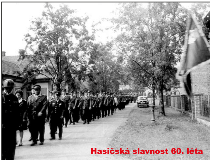
Hasičská slavnost 60. léta