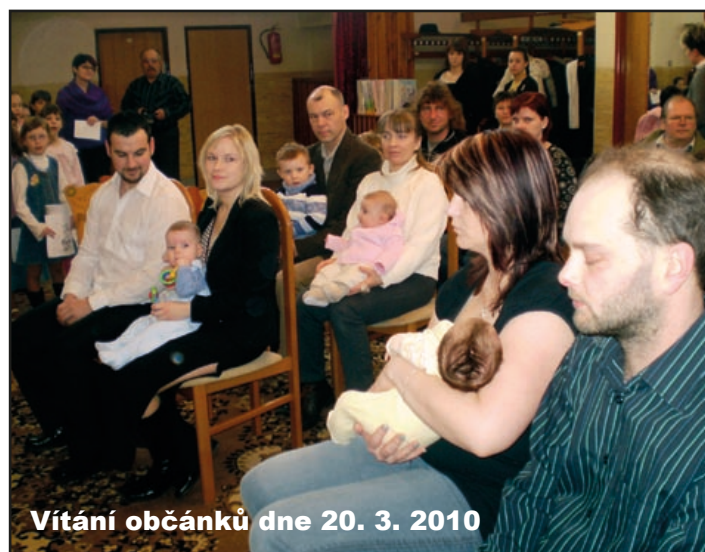
Vítání občánků dne 20. 3. 2010