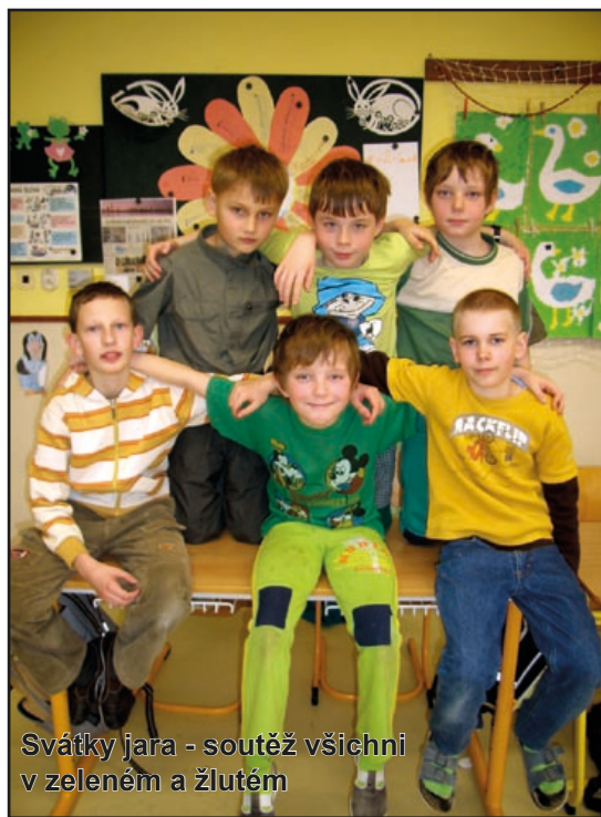
Svátky jara - soutěž všichni v zeleném a žlutém