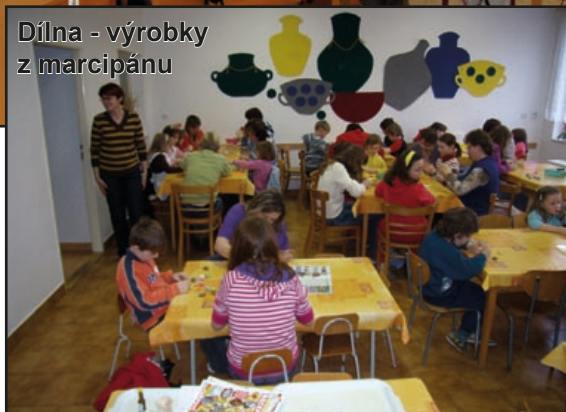
Dílna - výroby z marcipánu