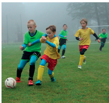
Přípravka – zápas v Lukové