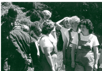
r. 1990 - Oslava 100. let od založení sboru