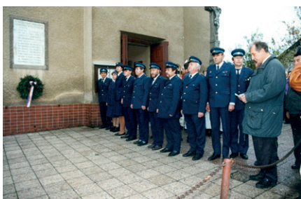
28. říjen 1998 – slavnostní svěcení obecního a hasičského praporu