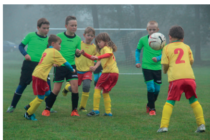
Přípravka – zápas v Lukové