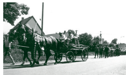
r. 1990 - Oslava 100. let od založení sboru - Verměřovická hasičská stříkačka z r. 1892