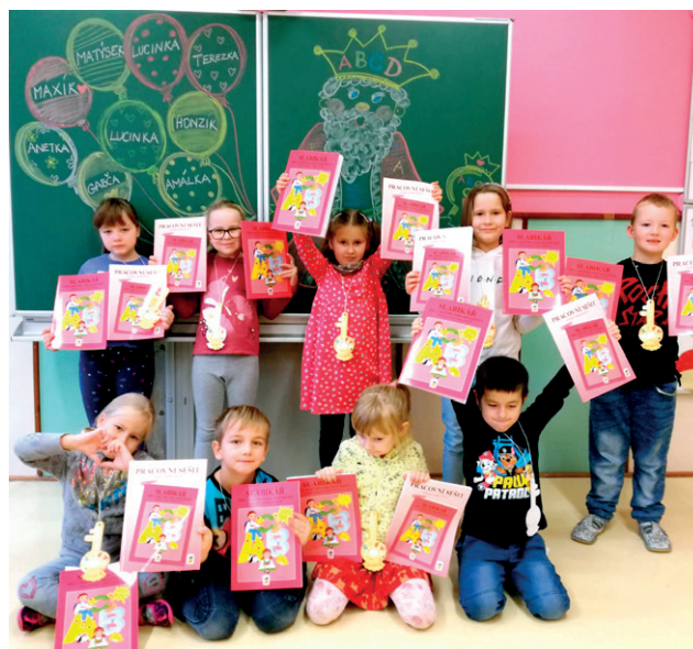
prvníáčci před novou tabulí

Také věřím, že Vás potěší přiložené fotky, na kterých vidíte práci Vašich dětí, drobné odměny, které jsme připravily k podzimním svátkům: sv. Martin, Halloween – Dušičky.