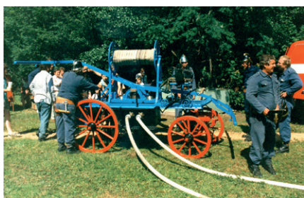
r. 1990 - Oslava 100. let od založení sboru - Verměřovická hasičská stříkačka z r. 1892