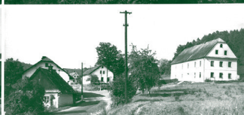
pohlednice ze 70. let minulého století

V první podzimní den ukázal teploměr ráno již -3^{\circ}\text{C} , krásné teplé dny byly na týden přerušeny deštivým a sychravým počasím, od 5. do 12. října vystoupily teploty až na +21^{\circ}\text{C} . Dne 15. října skončila sklizeň brambor. Podzim se ujal vlády, do rána 23. října napadl první sněhový poprašek, brzy však roztál. Na horách kolem zůstal ležet. Dne 30. října za deštivého, poměrně však teplého ( +12^{\circ}\text{C} ) počasí, ukončilo JZD sklizeň krmné řepy. Přeháňky prvního listopadového týdne přešly ve sněžení, sníh se však neudržel. Jako celek byl listopad mlhavý, sychravý s občasným deštěm. Ani začátek prosince se příliš nelišil od nevlídných listopadových dní. Až Mikuláš byl bílý, ale poprašek do tří dnů zmizel. Sychravé a mlhavé počasí s teplotami do +5^{\circ}\text{C} se udrželo do poloviny měsíce, teprve 18. prosince přituhlo a do večera napadlo asi 2cm sněhu. Vánoce nebyly na sníh bohaté, ale přece bílé. Za teplot slabě pod 0^{\circ}\text{C} mírně posněžovalo, dne 29. prosince přišla obvyklá slabší obleva a teprve Silvestr přinesl silné sněžení. Rok končil za teploty -4^{\circ}\text{C} s 10cm sněhovou pokrývkou.