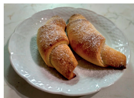
aktivita dětí – pečené Martinské rohlíky