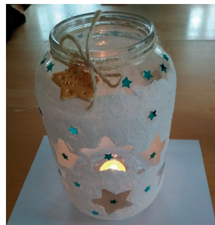
aktivita dětí – výroba lampiček