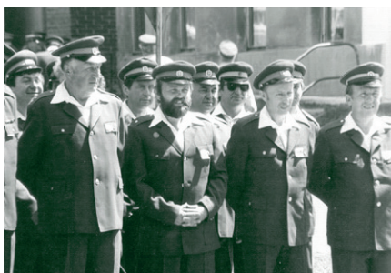
r. 1990 - Oslava 100. let od založení sboru