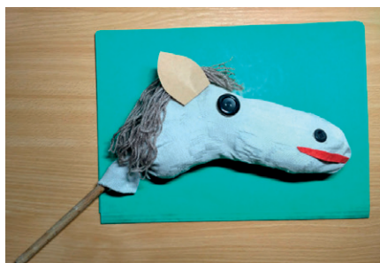
aktivita dětí – kůň sv. Martina

uvolňování nouzového stavu. Naši senioři se letos bohužel nedočkají svého společného Silvestrovského posezení, protože počet osob ve vnitřních prostorech je stále omezen. Myslíme ale na Vás a přijdeme za Vámi s malou drobností.