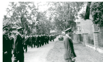
27. července 1969 – slavnostní odpoledne - Okresní den požární ochrany u příležitosti předání nové zbrojnice v Kulturním domě