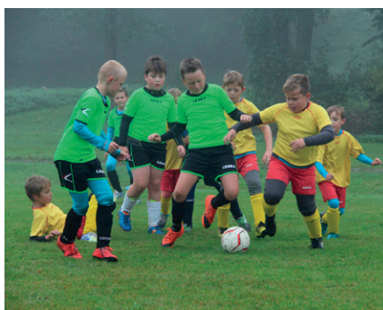
Přípravka – zápas v Lukové

Při psaní tohoto článku je zatím stále pozastavena sportovní činnost. Zatím nikdo z nás neví, kdy bude moci začít zimní příprava. Trénovat se však začne hned, jakmile to bude možné. Nepředpokládáme, že bude možné uskutečnit výroční schůzi v již tradičním čase před vánoci. Legislativa však stojí při nás a tuto situaci lze brát jako důvod valnou hromadu odložit. O termínu výroční schůze i valné hromady Vás, členy našeho spolku, budeme informovat. Taktéž uspořádání Štěpánské zábavy je pro tento rok asi nereálné. Zbývá mi tedy v tomto roce již jen popřát Vám krásné Vánoce, prožítí těchto svátků klidu a míru v kruhu Vašich nejbližších a do roku 2021 nám všem přeji hodně zdraví a štěstí.