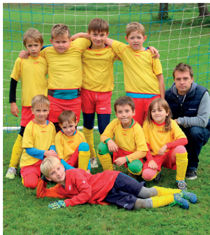
Přípravka – zápas v Lukové

je však úděl vesnického fotbalu a ve větší či menší míře je tato situace vidět i v okolních vesnicích. Jsem však přesvědčen, že udržet fotbal na vesnicích je důležité, a kdo jiný zde fotbal v budoucnu může udržet, než naše děti, pro které to všichni děláme. Rád bych Vás, touto cestou oslovil a požádal o pomoc při vedení tohoto týmu. Tréninkové jednotky pro tyto děti je nutné stavět pro malé skupinky a věnovat se jim naplno ve více trenérech. Jedině touto cestou jim pomůžeme dohnat týmy soupeřů (kde tuto metodu praktikují) a podpořit je v cestě k vítězstvím. Děkuji Vám.