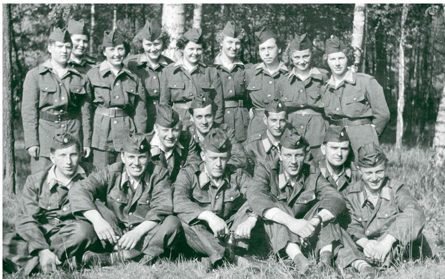
II. kolo soutěže pož. družstev, Verměřovice červen 1957