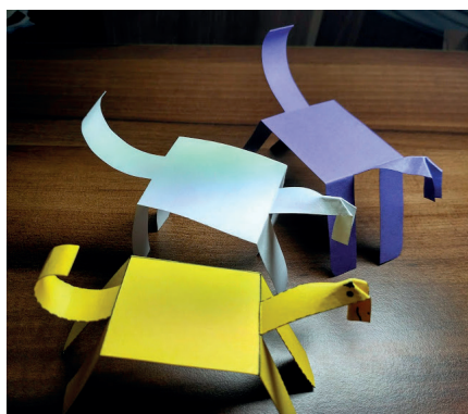
aktivita dětí – papírová výroba